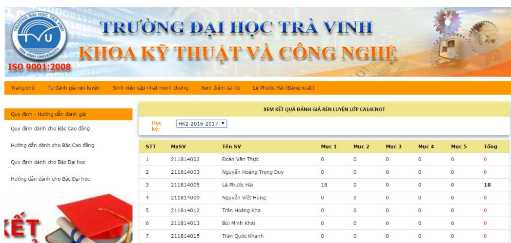
Hình 7: Giao diện Sinh viên xem điểm cả lớp

Sinh viên có quyền xem điểm của các thành viên khác trong nhóm bằng cách chọn Xem điểm cả lớp.