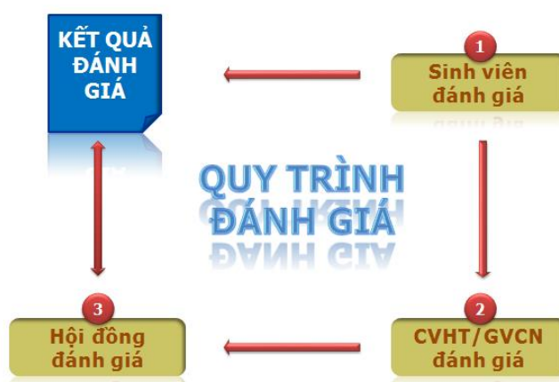
Hình 1 Quy trình đánh giá rèn luyện

Việc đánh giá đầu tiên được sinh viên thực hiện, sau đó cố vấn học tập sẽ xem xét trực tiếp trước lớp, cuối cùng cố vấn học tập sẽ là người đại diện sinh viên bảo vệ điểm trước hội đồng đánh giá. Điểm cuối cùng sau khi hội đồng đánh giá sẽ được công bố cho sinh viên. Sinh viên có quyền khiếu nại kết quả điểm rèn luyện nếu có minh chứng cụ thể. Khi đó, hội đồng sẽ xem xét để cập nhật lại điểm rèn luyện cho sinh viên.